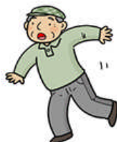
背中や腰の痛みのために 動作がぎこちない