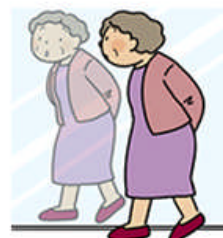
背中や腰が曲がったように感じる