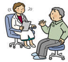
腰が痛い、レントゲン検査では 椎間板や脊柱管に異常がない

( http://www.iihone.jp/sitemap/index.html より)