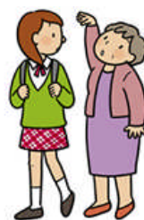
背が縮んだように感じる (実際に身長が縮んだ)